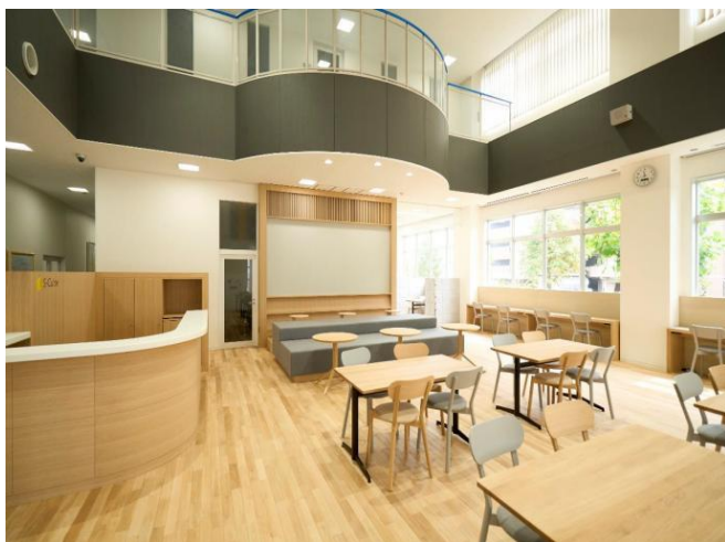
コミュニティスペース