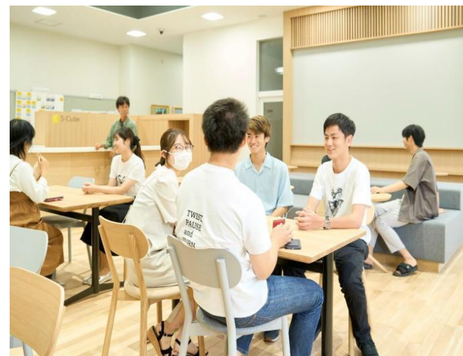
若者向けイベント