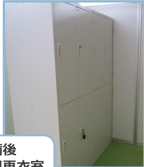
整備後 女性専用更衣室 と休憩室