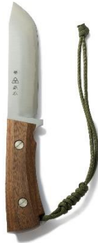
キャンプ専用ナイフ 「EIJIN」