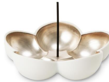
プレミアムインセンス ホルダー Fio