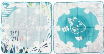
注染ダブルガーゼハンカチ 干支シリーズ（卯）