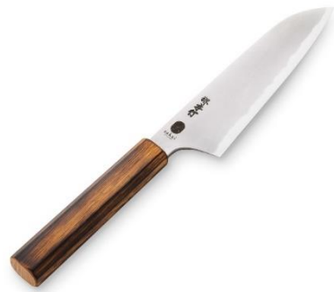
煤黒三徳包丁 堺キッチンオリジナル