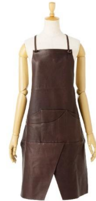
ウォッシュブル レザーハカマエプロン