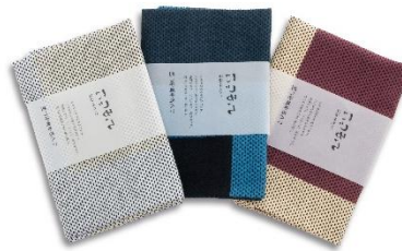
刺し子風手ぬぐい（3種）