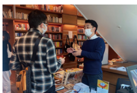
代官山 萬屋書店 ワークショップ