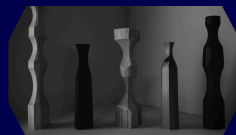
コラボ商品の誕生秘話など