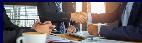
名刺交換・交流会