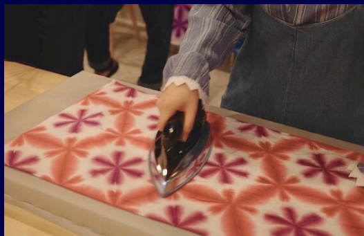
雪花絞り染め体験 (40分)