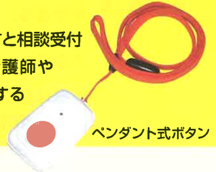
ペンダント式ボタン

また、相談通報用ボタンを押すと相談受付センターにつながり、専門の看護師や保健師に健康面などの相談をすることができます。