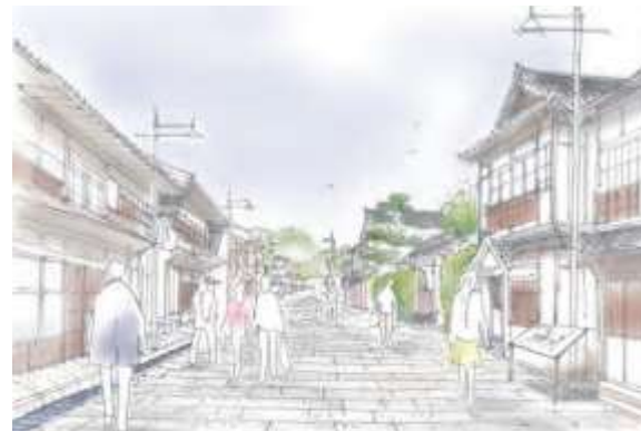
まちなみ再生のイメージ (街なみ環境整備事業パンフレットより)