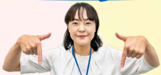
防犯担当の 堺区自治推進課参事

SNS型投資・ロマンス詐欺は、私のような50代男性の被害が一番多いです。私も気をつけないと!