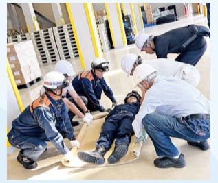
初動人命救助訓練