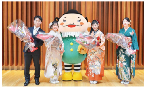
前回の若者実行委員の皆さん