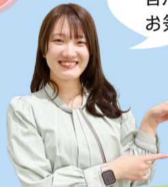
堺区自治推進課職員

自治会の加入については区HP (QRコード)か堺区自治推進課へ 堺区役所 自治推進課 (☎228-7082 FAX228-7844)