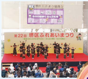
第22回堺区ふれあいまつり