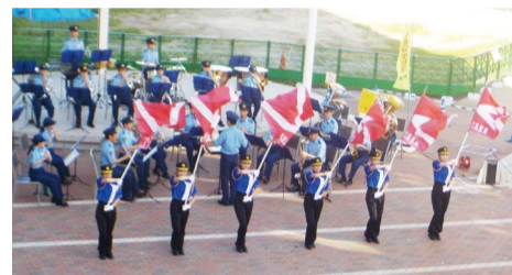
大阪府警察音楽隊も登場