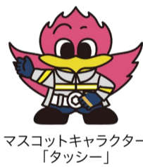
マスコットキャラクター「タッシー」

新たな消防用設備などが必要な場合もあるので、事業の開始や建物に変更がある場合は、あらかじめ消防署に相談してください。