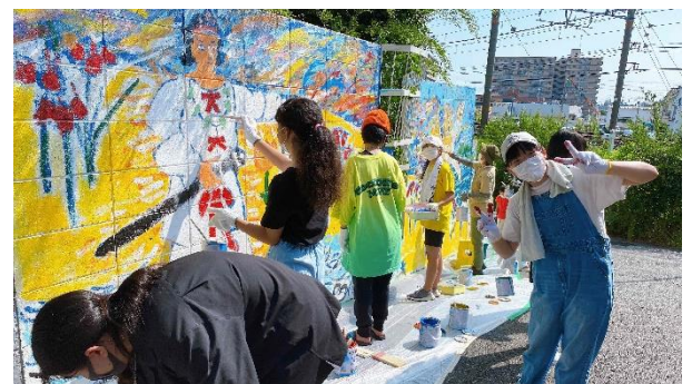
色塗りは、大阪公立大学の学生や劇団 Little★Star の劇団員も協力してくれました