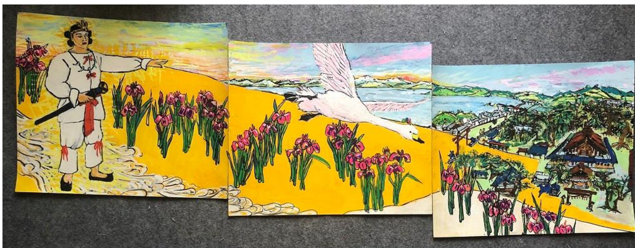
描かれる予定の壁画デザイン