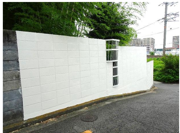
落書きを消した壁面