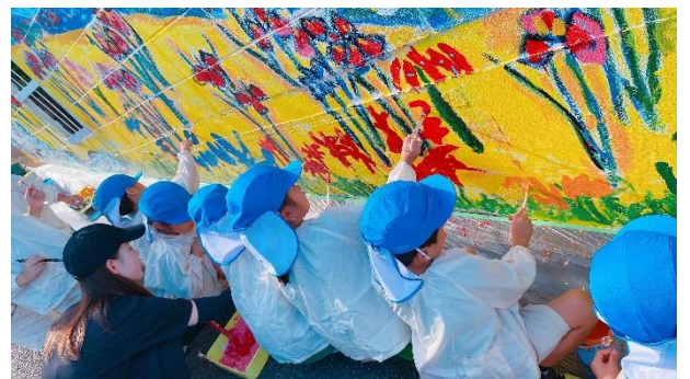
仕上げは近所のこども園の園児と一緒に