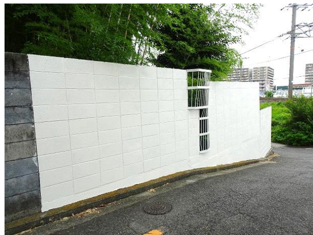
落書きを消した壁面