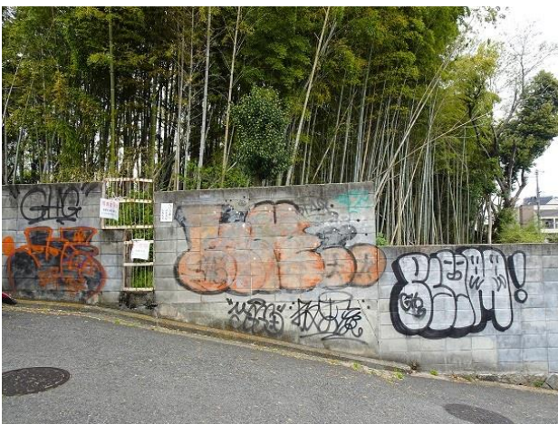
落書きされた壁面

そして8月29日（月）、近隣こども園児も参加して菖蒲の花びらへの色塗りなどを行い、ついに壁画アートが完成しました。