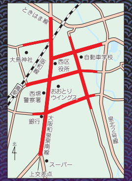
車両通行止め 午後0時30分～3時45分

西区だんじりのパレード開催に伴い、午後0時30分～3時45分、西区役所周辺の大阪和泉泉南線などで車両が通行止めとなります(地図参照)。 また当日、路線バス「石津」駅前(鳳駅前)「堺市立総合医療センター」前が全便運休となるほか、「堺東駅前-鳳駅前」が午後0時15分～4時25分の時間帯で下田南での折り返し運転、「鳳駅前-北野田駅前」「横山高校前-梅・美木多駅」一堺東駅前「梅・美木多駅-桃山台3丁」一堺東駅前「光明池駅-堺東駅前」が部分運休します。 ご迷惑をお掛けしますが、皆さんの協力をお願いします。