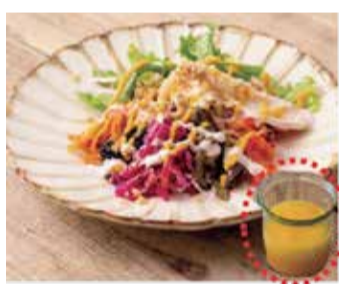
wabi-sabi 発酵と珈琲と。 西区浜寺昭和町1丁157