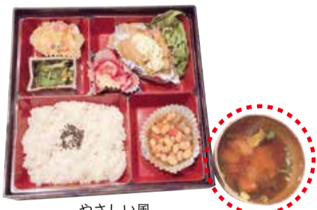
やさしい風 西区鳳東町4丁365-1