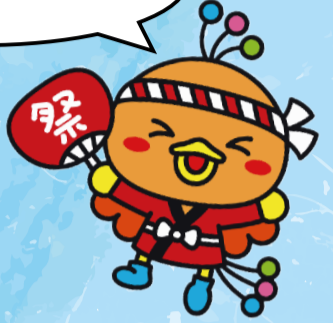
西区マスコットキャラクター ニッシーちゃん