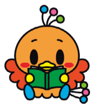
西区マスコットキャラクター ニッシーちゃん