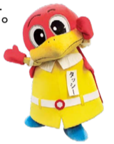
堺市消防局キャラクター「タッシー」