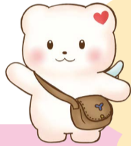
マスコットキャラクター ふわりん