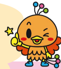
西区マスコットキャラクター ニッシーちゃん