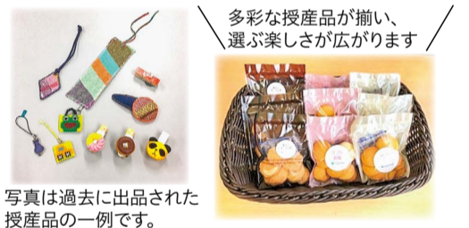
写真は過去に出品された授産品の一例です。