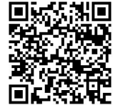
登録ページ QR コード

次回以降に市有地等の売却・貸付、飲料自動販売機設置・広告等の一般競争入札等を行う際、メールマガジンの登録者に一般競争入札等の実施についてお知らせします。 登録の上、ご活用ください。