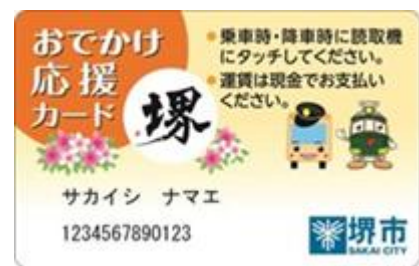
おでかけ応援カード