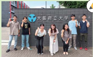
参加する学生の皆さん(一部)

若い方の意見を反映させるため、中区に所在する大阪府立大学の学生にも多数ご参加いただけます!