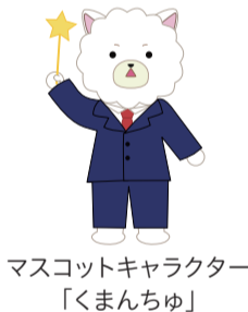
マスコットキャラクター「くまんちゅ」

日程 5月25・26日(雨天決行) 場所 大阪公立大学中百舌鳥キャンパス (中区学園町1-1) ☎友好祭実行委員会(☎254-9987)か 中区役所企画総務課(☎270-8181 FAX270-8101)