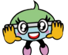
マスコットの「ビッグハローちゃん」