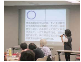
フォローアップ研修

☎8月2～24日に、電話、FAX、電子メールで、住所、氏名、電話番号を書き、同センターへ。