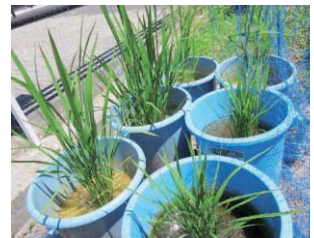
みみちゃん田んぼの様子

6月に植えた稲の苗が根付き、茎や葉がどんどん増えています。「おうちで稲作体験」の企画に参加している子どもたちから稲の観察レポートが届いています。観察レポートは南区ホームページで公開中。稲の成長と一緒に楽しみましょう。 ☎南区役所区政企画室(☎290-1805 FAX290-1814)