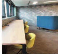
オープンスペース

月～金曜日(12月29日～ 1月3日・祝日を除く)1日、 午前(9～12時)、午後 (13～17時)のいずれか。