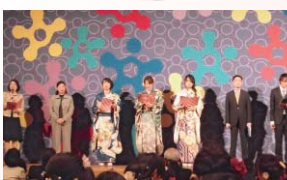
前回の成人式の様子