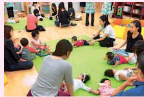
あかちゃんタイム