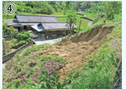
④ 別所地区での土砂災害 (写真④)(2023年5月8日)