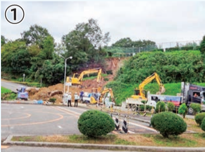
① 鉢ヶ峯寺～泉北自動車学校での土砂災害 (写真①)(2016年)