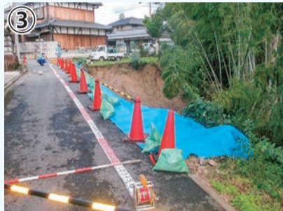
② ③ 上神谷地区での土砂災害 (写真②、③)(2016年)