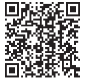
堺市南区基本計画