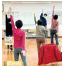
過去の教室の様子