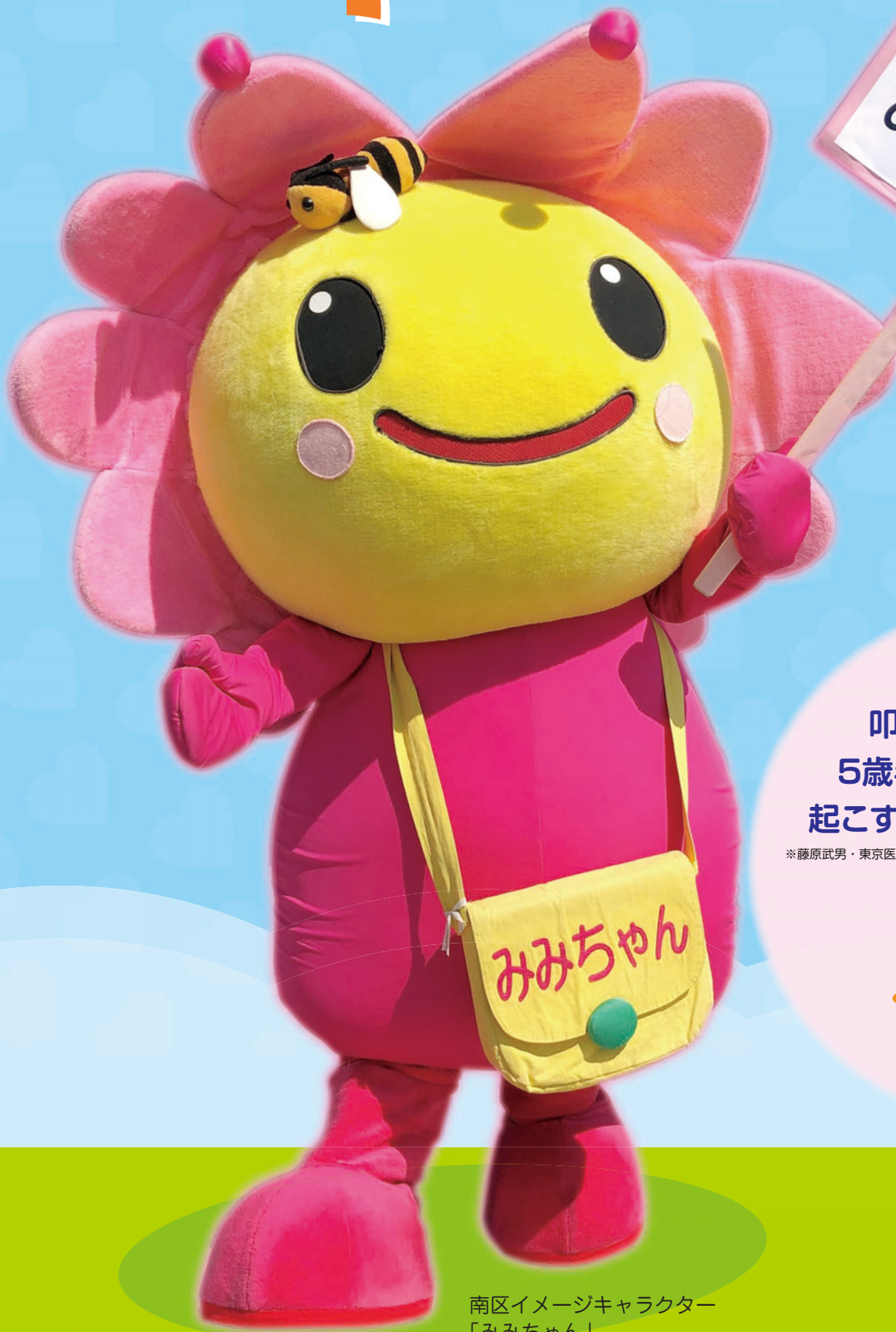
南区イメージキャラクター 「みみちゃん」