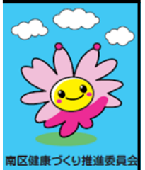
南区健康づくり推進委員会