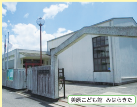
美原こども館 みはらきた