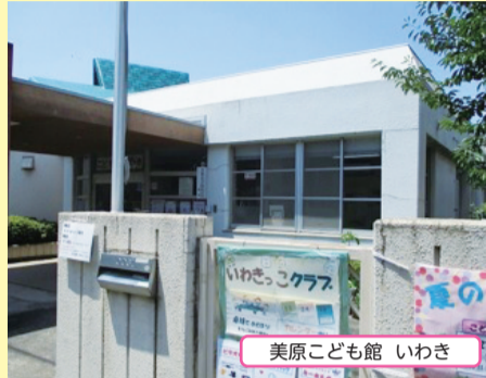
美原こども館 いわき