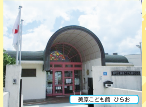
美原こども館 ひらお