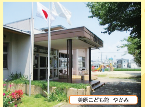
美原こども館 やかみ