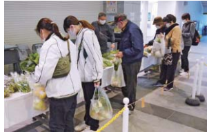
美原区役所での朝市