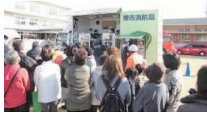
黒山校区自主防災訓練の様子