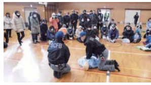
美原西校区自主防災訓練の様子