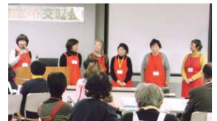
堺市8020メイト交流会