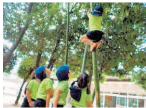
竹登りをする園児

☎☎同園(☎361-8772 FAX361-5500)か学務課(☎228-7485 FAX228-7256)へ。