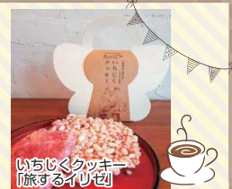
いちじくクッキー「旅するイリゼ」