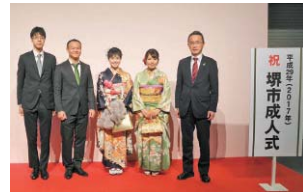
前回の実行委員の皆さんと美原区長(一番右)

☑郵送か FAX、電子メールで住所、氏名(ふりがな)、電話番号、生年月日、希望項目名(②は400字程度の発表内容)を7月31日(必着)までに美原区役所自治推進課(〒587-8585 美原区黒山167-1 ☎363-9312 FAX361-1817 jishin@city.sakai.lg.jp)へ。選考①1人、②1人(グループも可)、③若千名(グループも可)。