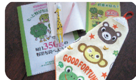
プレゼントの一例