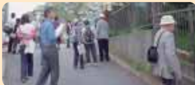
平尾地区まち歩き