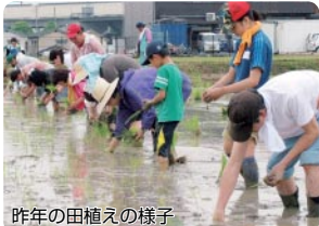
昨年の田植えの様子

緑豊かな農地が広がる美原区では、毎月第2・4土曜日に美原朝市が行われるなど農業でつながるまちづくりが進んでいます。