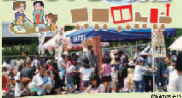
前回のあそびいちばの様子(左・右)

今年で20回目となる「あそびいちば」を、5月12日(土)、午前10時～午後2時、みはら大地幼稚園で開催します。入場無料。雨天決行。主催は、あそびいちば実行委員会です。なお、当日は同園への車の乗り入れはできませんので、美原中学校へ駐車し、美原中学校臨時バス乗り場から同園への臨時シャトルバスをご利用ください。