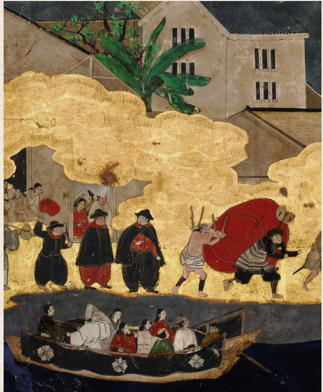
住吉祭祀図屏風(部分)

堺環濠都市遺跡は、戦国の世を中心に栄えた「堺」の街並みや生活を土中に残しています。数々の発掘調査成果で見つかった、「堺」の繁栄ぶりとその特徴を紹介します。