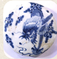
肥前染付 蓋 堺市文化財課所蔵

堺環濠都市遺跡で使われていた、兎や龍が描かれた器と、現代の紙工作作家が立体的に作ったいきものの作品を展示します。