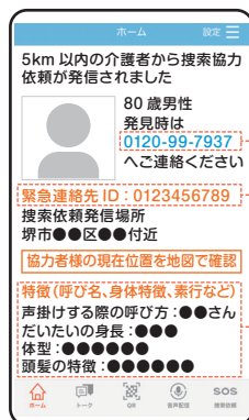
配信情報イメージ

発見したら、検索者情報に表示されているフリーダイヤルに連絡してください。ID番号を入力すると直接依頼者に電話がつながります。 (その際、 あなたの電話番号等の情報は依頼者に表示されません。 )