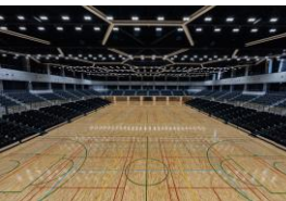
大浜だいしんアリーナ