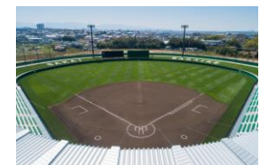
くら寿司スタジアム堺