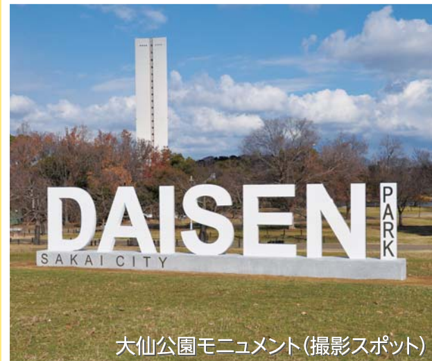
大仙公園モニュメント(撮影スポット)