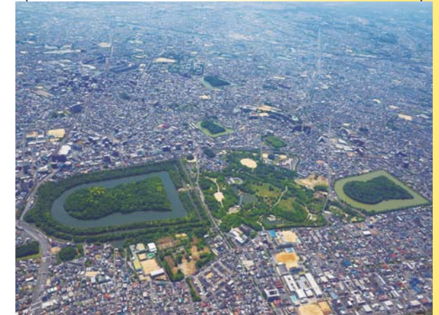
(上写真左)仁徳天皇陵古墳 (上写真右)履中天皇陵古墳

仁徳天皇陵古墳と履中天皇陵古墳の間に広がる緑と歴史に囲まれたたいへん美しい堺市のシンボルパークです。