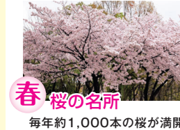
春 桜の名所 毎年約1,000本の桜が満開