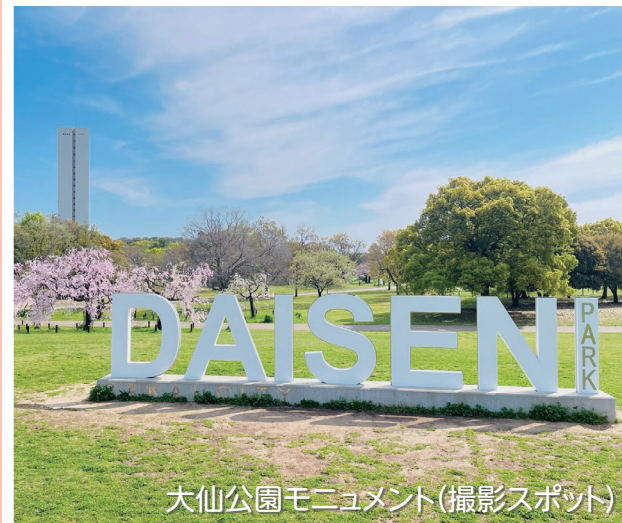
大仙公園モニュメント(撮影スポット)