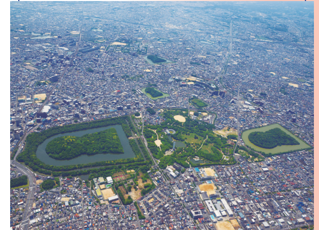
(上写真左)仁徳天皇陵古墳 (上写真右)履中天皇陵古墳

仁徳天皇陵古墳と履中天皇陵古墳の間に広がる緑と歴史に囲まれたたいへん美しい堺市のシンボルパークです。