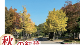
秋の紅葉 イチヨウ並木、ケヤキなどの色鮮やかな紅葉