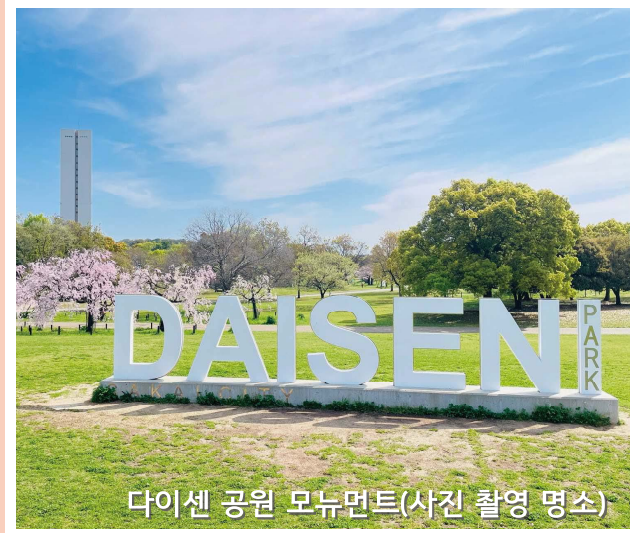
다이센 공원 모뉴먼트(사진 촬영 명소)