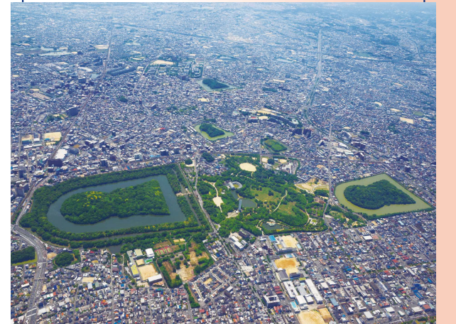
(위 사진 왼쪽) 닛토쿠 천황릉 고분 (위 사진 오른쪽) 리추 천황릉 고분

닛토쿠 천황릉 고분과 리추 천황릉 고분 사이에 펼쳐진 숲과 역사에 둘러싸인 매우 아름다운 사카이시의 상징적인 공원입니다.