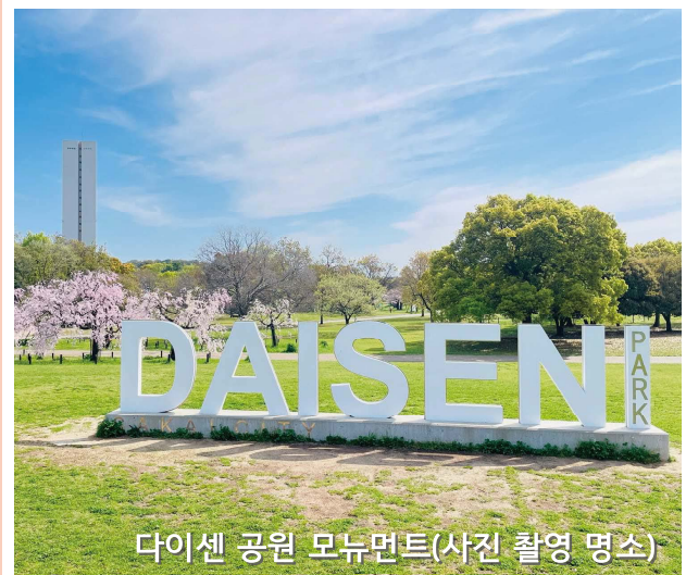
다이센 공원 모뉴먼트(사진 촬영 명소)