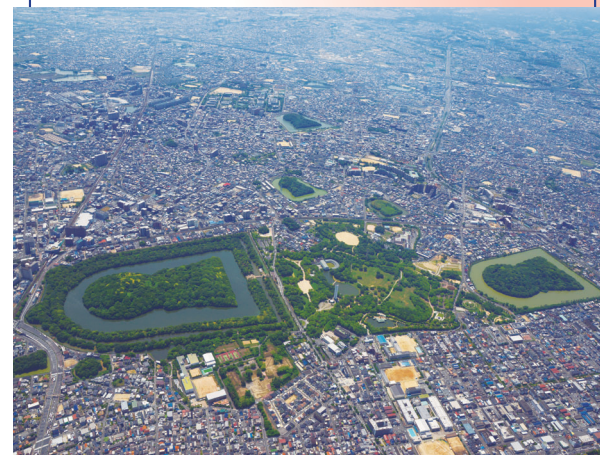
(上方照片左侧) 仁德天皇陵古坟 (上方照片右侧) 履中天皇陵古坟

坐落在仁德天皇陵古坟及履中天皇陵古坟之间,是绿意盎然、富有历史底蕴、美不胜收的堺市代表性公园。