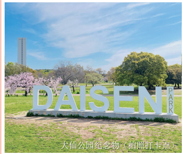
大仙公园纪念物(拍照打卡点)