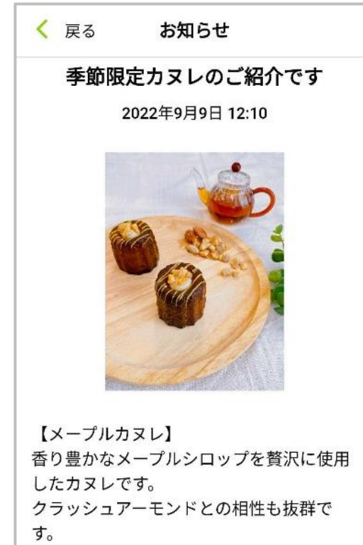
※アプリデザインはイメージです