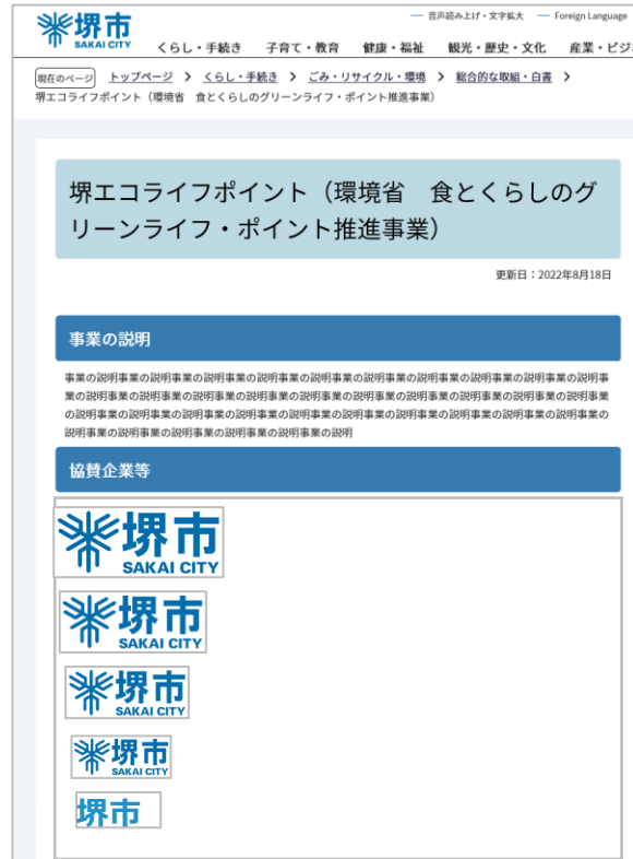
※ホームページデザインはイメージです